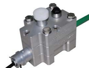
Lubricator L9 Pour la lubrification continue des Câbles pour une meilleure performance de soufflage