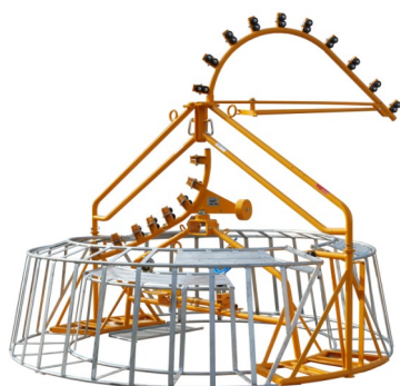
Figaro Système de stockage intermédiaire