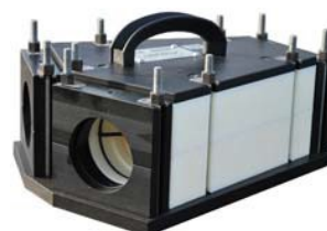
Embranchement Y Pour l'installation d'un câble dans un Tube déjà occupé

Spécifications sous réserve de modifications — Photos non contractuelles