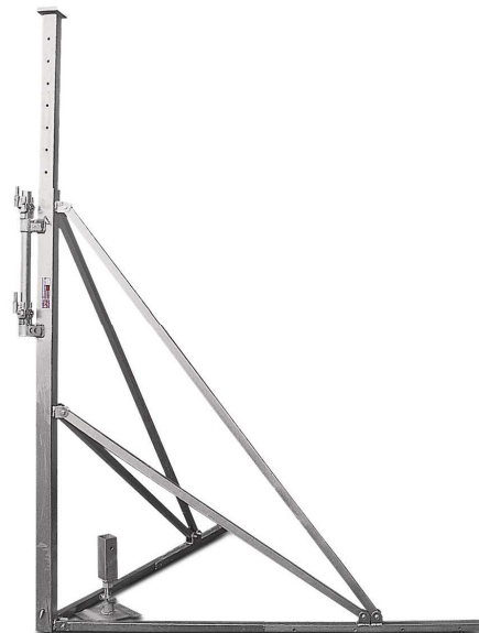
Réf. 1913 Type D de 2m10 à 3m40 80 kg