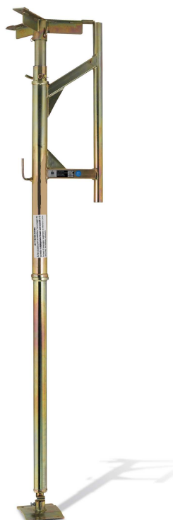
Réf. 1910 Type A de 2m50 à 3m30 39 kg